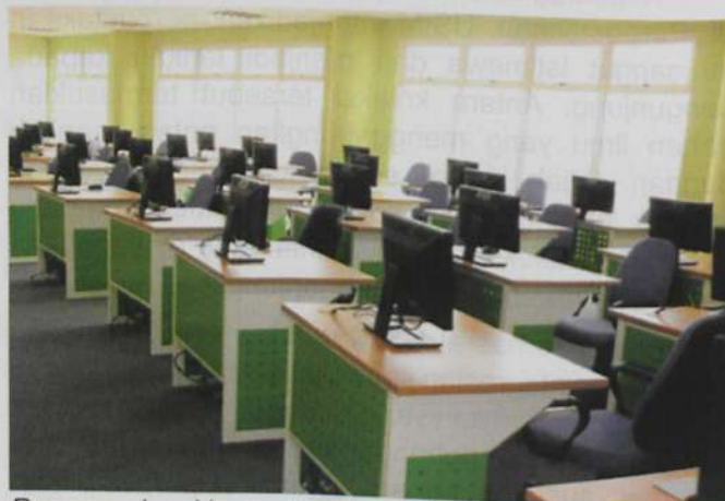
Ruang makmal komputer.