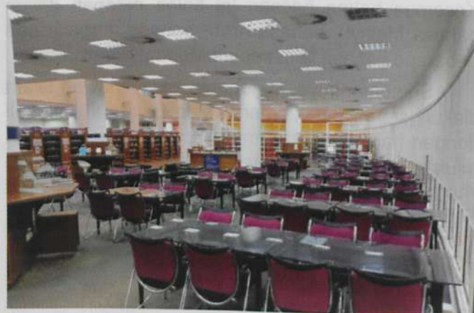
Ruang untuk pengunjung Perpustakaan USIM.

Memandangkan tiada sebuah perpustakaan awam yang lengkap dibina untuk orang awam di daerah Nilai hingga kini, maka atas rasa tanggungjawab terhadap masyarakat sekitar, mulai bulan Oktober tahun 2018, Perpustakaan USIM telah dibuka kepada orang awam, berbanding dengan sebelumnya yang hanya terhad kepada warga USIM sahaja dan warga universiti awam yang lain. Hal ini membolehkan orang ramai masuk ke Perpustakaan USIM secara percuma bagi menggunakan kemudahan ruang bacaan untuk membaca dan membuat rujukan. Perpustakaan ini menyediakan lebih 1500 tempat duduk untuk keselesaan pengunjung.