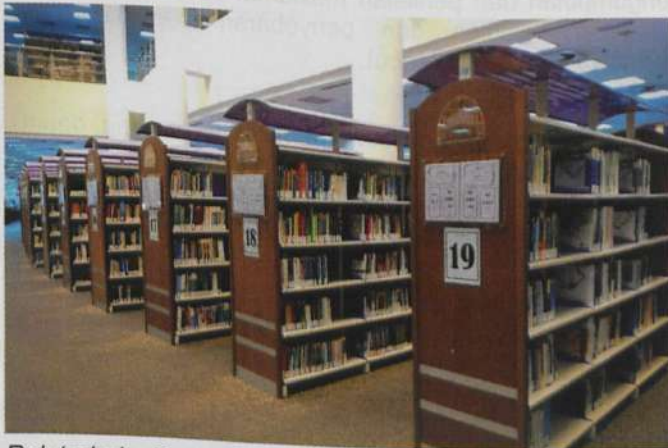
Rak terbuka Perpustakaan USIM.