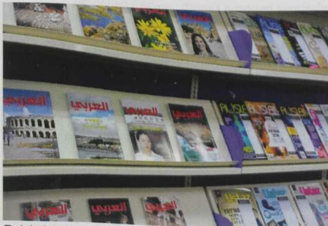
Rak koleksi majalah.

Bangunan Perpustakaan berketinggi empat tingkat ini juga menyediakan ruang yang sesuai untuk dinikmati. Bagi mereka yang ingin bersendirian, terdapat meja karek dan bilik karek disediakan khusus untuk mereka yang selesa membaca, atau membuat kerja secara individu, manakala bagi mereka yang datang secara berkumpulan atau suka membaca dengan suasana ramai orang, terdapat ruang bacaan yang terbuka untuk mereka. Sementara itu, bagi mereka yang ingin mengadakan perbincangan dalam bentuk berkumpulan dan tertutup, perpustakaan ini mempunyai 10 buah bilik perbincangan yang boleh ditempah mengikut keperluan.