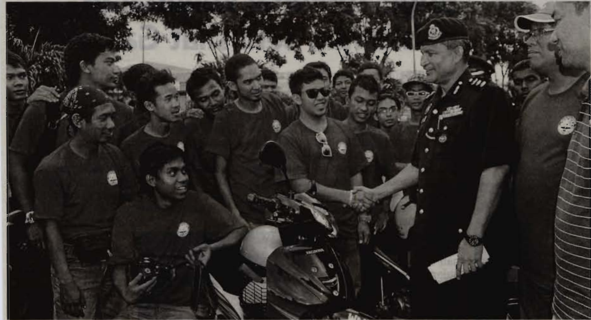
AKTIVITI bersama masyarakat mampu lahirkan generasi muda yang berjiwa kental.